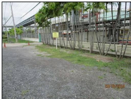
ภาพถ่ายที่ 1.4-1 สภาพพื้นที่โดยรอบโครงการ